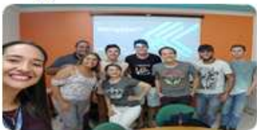
Diálogo com a diretora com os líderes de turma, de todos os cursos.