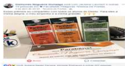
Premiação de Professores e Coordenadores na IES.