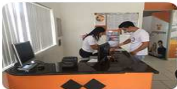
Foco no atendimento – contratações; triagens e treinamentos.