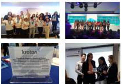
Diversas premiações dentro da Kroton.