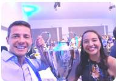
A Faculdade Pitágoras de Teixeira de Freitas ganhou a "Liga dos campeões", ela é destaque dentro da Kroton.