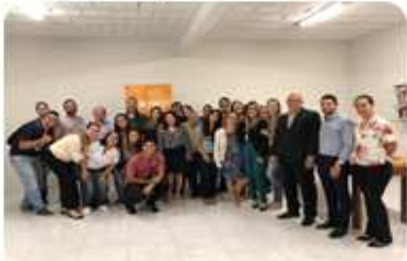
Valorização dos Discentes que se engajam. #Desafionotamáxima