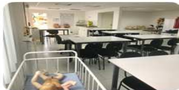
Revitalização e construção de laboratórios.