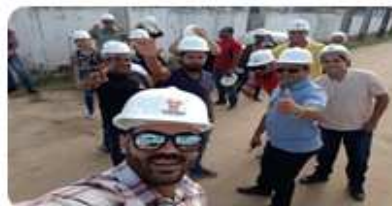
Tem mais...Reforma das passarelas, fachada, rede elétrica, estacionamento. Clínicas escola a todo vapor. Ações de responsabilidade Social. Aulas práticas.