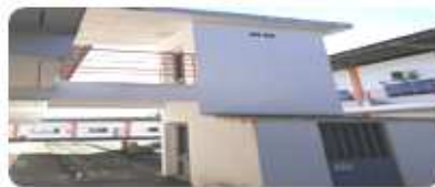
Entrega dos elevadores.